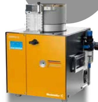
フェール端子用 自動圧着機