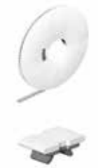
(DEK 5/3.5 MM WS)