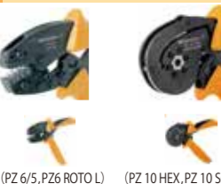
(PZ 6/5, PZ 6 ROTO L) (PZ 10 HEX, PZ 10 SQR)