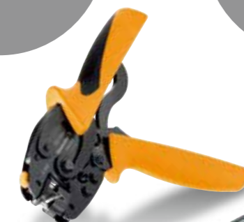
フェール端子用 圧着ツール