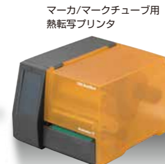
マーカ/マークチューブ用 熱転写プリンタ